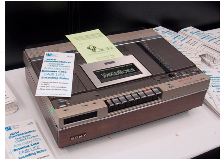
Betamax, SONY, at CES 2004